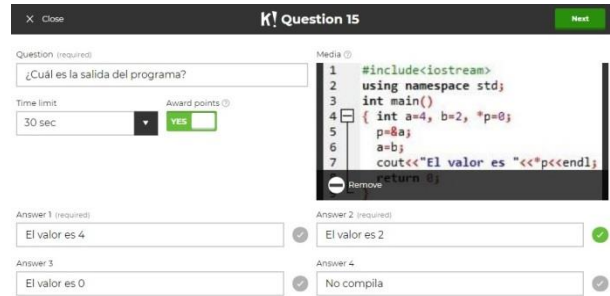
Figura 2. Pantalla de edición de una pregunta 15 en Hahoot

En la configuración de las mismas, se ha dispuesto treinta segundos, para favorecer el diálogo entre los miembros del equipo.