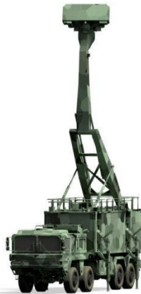
Figura 2: RADAR Transportable “Giraffe”

Para la detección no cooperativa para vuelos de baja cota, inclusive para medios de baja detectabilidad, puede implementarse el viejo concepto de detección multiestática (ver Figura 3), con las evoluciones que esté ha registrado [9].